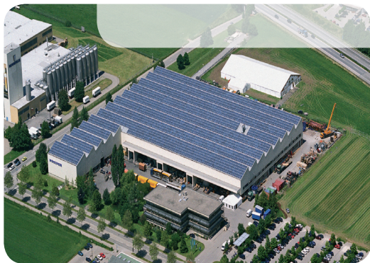
SMA Solar Technology AG

Το πρόγραμμα αυτό αποτελεί έναν από τους άξονες δράσης που εξήγγειλε πρόσφατα ο Όμιλος της Τράπεζας Πειραιώς από κοινού με τα υπουργεία Περιβάλλοντος, Ενέργειας και Κλιματικής Αλλαγής (ΥΠΕΚΑ) και Οικονομίας, Ανταγωνιστικότητας και Ναυτιλίας (ΥΠΟΙΑΝ) και αποσκοπεί στην ενίσχυση της Πράσινης Ανάπτυξης.