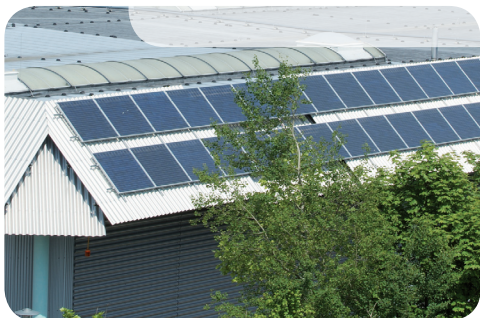
SMA Solar Technology AG

Με βάση τη νομοθεσία, κάθε κιλοβατώρα που παράγεται από το φωτοβολταϊκό σύστημα, πωλείται στο δίκτυο έναντι 0,40-0,45 €/kWh, μία τιμή που είναι εγγυημένη από το νόμο για μια εικοσαετία. Έτσι, η επιχείρησή σας θα έχει ένα σημαντικό εγγυημένο ετήσιο έσοδο.