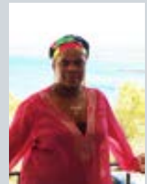
HAM Πριγκίπισσα Muzvare Betty Makoni

Το επίκεντρο της δουλειάς της είναι η ανάδειξη «Επιτευγμάτων, σκέψεων και εννοιών» που συμβάλλουν στην αλλαγή της νοοτροπίας των υπερήφανων ανθρώπων της Αφρικής. Η Πριγκίπισσα Deun λέει για το έργο της στα μέσα ενημέρωσης: «Είναι πράγματι μια προβολή των ισχυρών κίνητρων, με εκπαιδευτικές και επιχειρηματικές πτυχές, με κάποια διασκέδαση σε ένα μη εκφοβιστικό περιβάλλον!»