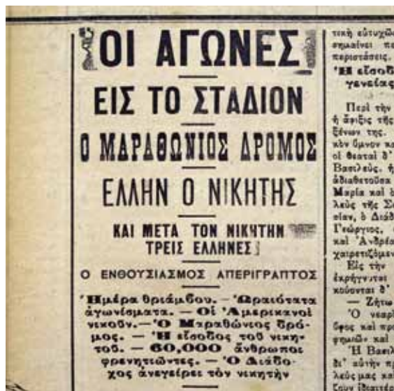
The ASTY newspaper's report on the marathon race, published the day after.

Ἡ αναφορά τῆς εφημερίδας ΑΣΤΥ στον μαραθῶνιο, που δημοσιεύτηκε τὴν επομένη ἡμέρα τοῦ ἀγῶνα.