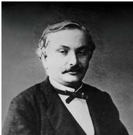
Michel Jules Alfred Bréal (1832 - 1915) Ο Μιχαήλ Ιούλιος Αλφρέδος Μπρεάλ (1832 - 1915)

The race that Bréal envisioned was based on the legend that in