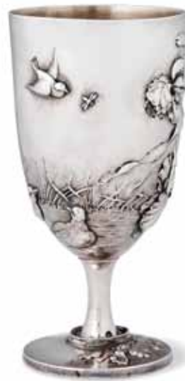
The reverse side of the Bréal Cup Η πίσω πλευρά του κυπέλλου Μπρεάλ

Αμέσως μετά την αποδοχή της ιδέας του Μαραθωνίου και του ειδικού βραβείου, το εν λόγω κύπελλο φιλοτεχνήθηκε από ασημί. Τα μετάλλια των νικητών των Ολυμπιακών Αγώνων του 1896 ήταν επίσης ασημένια. Τα χρυσά μετάλλια για τους νικητές υιοθετήθηκαν αργότερα. Συμβαδίζοντας με τη μετριοφροσύνη που χαρακτήριζε την Ολυμπιακή παράδοση, το μέγεθος του κυπέλλου ήταν σχετικά μικρό, με ύψος 15