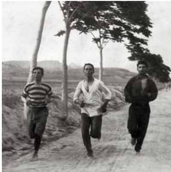
Athletes in training for the marathon at the 1896 Olympic Games in Athens. Αθλητές προπονούνται για τον μαραθώνιο στους Ολυμπιακούς Αγώνες του 1896 στην Αθήνα.

την ιδέα του αγώνα, φαντάστηκε ότι θα ξεκινούσε από τον Μαραθώνα και θα τελείωνε στην Πνύκα, τον λόφο στους πρόποδες της Ακρόπολης, όπου είχε συγκληθεί η συνέλευση των Αθηναίων και όπου ο αγγελιοφόρος έκανε την ανακοίνωσή του. Για πρακτικούς λόγους, ωστόσο, ο τερματισμός του Μαραθωνίου έπρεπε να γίνει στο Παναθηναϊκό Στάδιο, το οποίο φιλοξενούσε τους Ολυμπιακούς Αγώνες του 1896. Στην αλληλογραφία του με τον Δημήτριο Βικέλα, τον σύνδεσμο του Κουμπερτέν με τους διοργανωτές στην Αθήνα, ο Μπρεάλ εξέφρασε ρητά την ιστορική σημασία της ιδέας του.