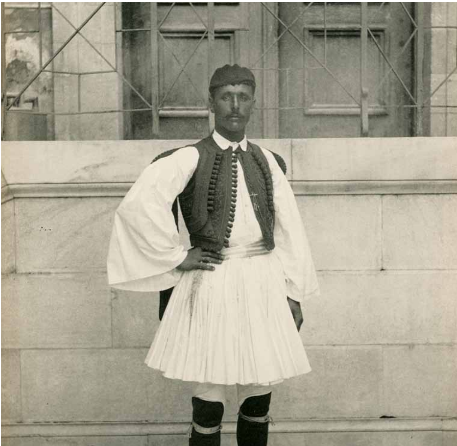
Portrait of Louis in national costume. Album of Olympic Games 1896, Historical Archives, Benaki Museum. Πορτραίτο του Λούη με εθνική ενδυμασία. Λεύκωμα των Ολυμπιακών Αγώνων, 1896, Ιστορικά Αρχεία, Μουσείο Μπενάκη.