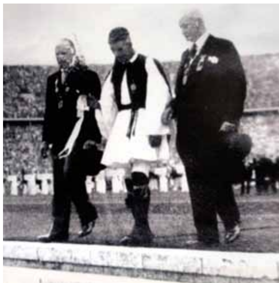
Louis in the Olympic Stadium, Berlin 1936 Ο Λούης στο Ολυμπιακό Στάδιο, Βερολίνο 1936.

πόλεμο ενάντια στην Οθωμανική Αυτοκρατορία το 1897 και συνέχισε να υποστηρίζει τις προσπάθειές του για την ενίσχυση των Ολυμπιακών Αγώνων, ενθαρρύνοντάς τον να διασφαλίσει την καθέρωση του Μαραθωνίου Δρόμου ανάμεσα στα αγωνίσματά τους. 17 Ο Μπρεάλ πέθανε σε ηλικία ογδόντα τριών ετών το 1915 και εξυμνήθηκε για την τεράστια συνεισφορά του στη σημασιολογία και τη γαλλική δημόσια παιδεία. Μία νεκρολογία που γράφτηκε από το διάσημο Γάλλο Αιγυπτιολόγο Gaston Maspero είχε έκταση τριάντα έντυπες σελίδες. 18 Ο Λούης δε συμμετείχε ξανά σε Μαραθώνιο και αποσύρθηκε αμέσως από το φως της δημοσιότητας, συνεχίζοντας τη ζωή του στο Μαρούσι. Από όλες τις προσφορές που έλαβε, διάλεξε μία νέα άμαξα για να μπορέσει να μεταφέρει νερό. Το 1936 ήταν καλεσμένος των διοργανωτών των Ολυμπιακών Αγώνων του Βερολίνου. Πέθανε το 1940, σε ηλικία εξήντα επτά ετών, έχοντας κερδίσει μια μόνιμη θέση στην ιστορία της σύγχρονης Ελλάδας και το σύγχρονο ελληνικό λεξιλόγιο, όπου καθιερώθηκε η έκφραση, για κάποιον που εξαφανίζεται γρήγορα, «Έγινε Λούης».