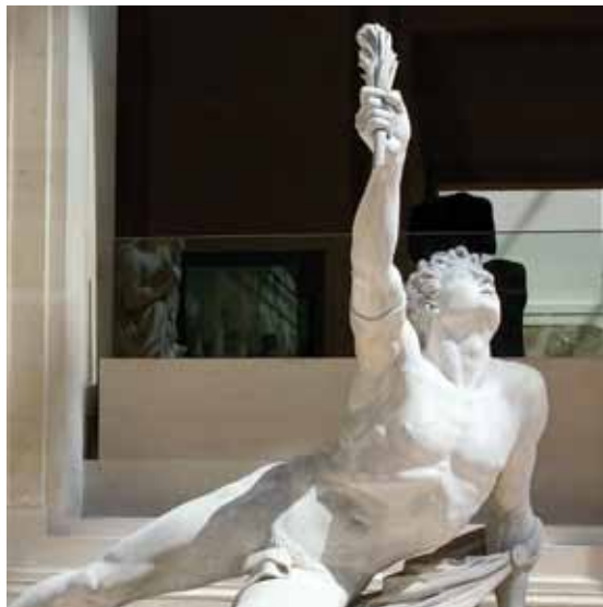
The Soldier of Marathon sculpture by Jean-Pierre Cortot (French, 1787-1843), Louvre Museum. "Ο Στρατιώτης του Μαραθώνα" γλυπτό του Jean-Pierre Cortot (Γάλλος, 1787-1843), Μουσείο του Λούβρου.

battle of Marathon in historical but also symbolic terms grew steadily. To the extent that one can identify consensus among historians of Classical Greece there is agreement that the Greek victory at Marathon did not mean Athens won the war, but rather that it was one of several events and battles that eventually eliminated the Persian threat. Yet it is undeniable that it represented an enormous psychological gain for the Athenians. Herodotus viewed the battle as the beginning not the end of the wars against the Persians, and Themistocles regarded the battle as a prelude and part of a greater struggle. But soon history gave way to legendary associations. The playwright Aeschylus who fought there and who lost his brother in the battle depicted it as a victory of free men, living in a democracy, over a monarchy that ruled over vassals. Gradually the battle grew in significance. Pausanias asserts that the local people of Attica worshipped its battle heroes as divine. The value attached to Classical Greece in the minds of 18th and 19th century literary figures in Europe contributed to the amplification of the battle's symbolism. Samuel Johnson, the prominent 18th century English author and essayist, saw it as an important reflection of patriotism. Lord Byron considered it a magic word associated with the idea of freedom, and John Stuart Mill believed it to be more important to British history than the battle of Hastings, which ushered in the Norman conquest of England in 1066. 2